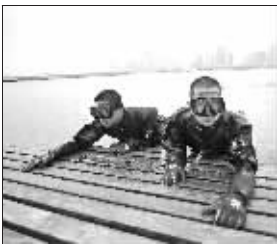
蛙人在青岛进行水下安检演练