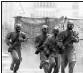
秦皇岛举行防生化演习