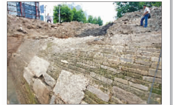
狮子山公园附近的古城墙遗址 快报记者 施向辉 摄

历史上的白下城 白下城在南京西北面,本名叫白石陂。白下城选址于东晋时期的白石垒下,始建于刘宋时期,在南朝齐时又经过一次大规模修筑。白下城是六朝建康城的一道卫城,起着非常重要的军事防御作用。公元622年,因为白下城的缘故,把金陵更名为白下。