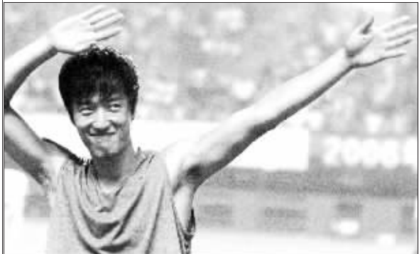
刘翔化解压力自有一招

去年大阪世界田径锦标赛决赛当天,刘翔抽签排在了“死亡之道”第九道,而罗伯斯却是排在了位置最好的“种子道”。上场前,刘翔仰天长笑一声,并紧紧地握了下教练孙海平的手,这两个异常举动令孙海平和现场一百多名记者担心不已。但刘翔最终顶住压力拿到了冠军,而罗伯斯却因为太在意刘翔,一路跑得非常不顺,只获得第四名。“我个人认为,罗伯斯的最大问题是心理素质差。”杨明说。