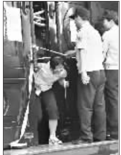
拿着钞票,女孩开心地说出微启的大门