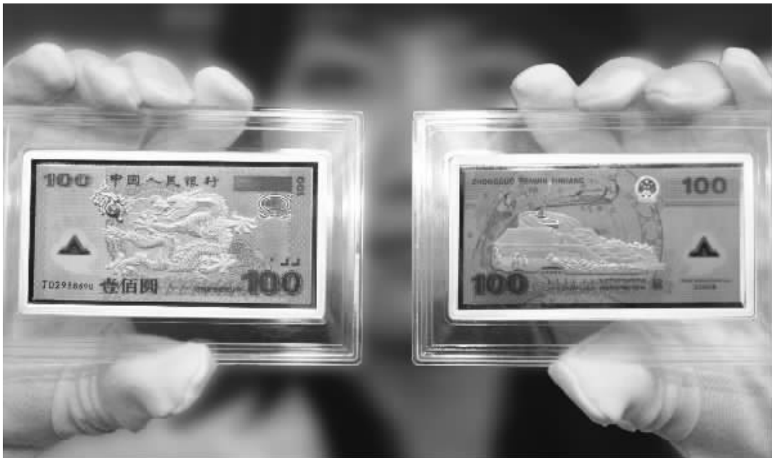
全套 36 克纯金、512 克纯银,以沙面浮雕技术,采用贵如黄金的变色油墨印刷、激光全息等世界顶级印钞技术铸造,具有不怕水、不怕潮、不反光、可永恒珍藏的优越特性。

上海印钞厂和上海造币厂联合铸造,历史上钱币每一枚都价值连城,36 克纯黄金铸造创造纪录,更何况它是“人民币的金”!其珍贵程度等同价值 300 万的第一套人民币! 本品由上海印钞厂和上海造币厂首度联合印制铸造,代表当今世界印钞造币工艺的巅峰之作,可万年珍藏。钱币专家刘正昌说:在货币史上,第一枚的收藏价值都非常高,中国第一枚流通货币人民币,现在每枚的价值高达 160 万,中国第一枚开元通宝的价值是 37 万。在古代,只有在皇帝更换年号时才偶尔使用黄金来铸造纪念货币,现在