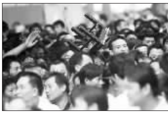
高举的凳子是我们的好伙伴