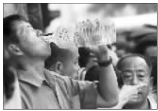
天太热,喝口水降降温