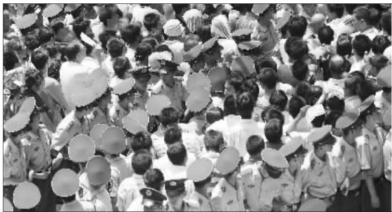
武警组成一道道人墙,全力维持现场秩序