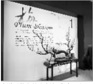
名为“梅”的主新闻发布厅门口

售卡机、银行、邮局、快递中心、医疗点、药店、特许商品店、干洗店、理发店、旅行社、小型超市等生活设施。 关键词:看世界 在IBC(国际广播中心)一楼大厅的休息处,一面电视墙前不少外国记者驻足,因为这里可以看到除了央视一套、九套和奥运频道的节目外,还可以看到BBC(英国)、CNBC(美国)、NHK(日本)、KBS(韩国)、TV5 MONDE ASIE(法国)、EURO SPORT(欧洲体育频道)等在内的世界主流电视台节目。对于各国记者来说,想看到奥运会期间来自世界主流电视台的图像,听到全世界的声音,都是一件再简单不过的事情。 关键词:中国风 主新闻中心内的发布厅最具中国特色,以“梅”“竹”“兰”“菊”“松”命名的5个新闻发布厅之中,最大的“梅”厅可容纳800人。奥运会前后,五个新闻发布厅将全天轮转,承担超过400场的各类新闻发布会。 悬在天花板上的中国纸伞,墙壁上的风筝,王羲之、颜真卿的真迹仿本,以及凸显山水园林风格的花苑,主新闻中心已成为中国向全世界展示自己的最好舞台。捷报奥运联盟特派记者 刘苏(快报北京电)