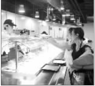
记者在 MPC 购买午餐