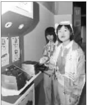
MPC提供免费的手机充电设备