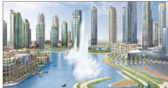
“世界最大喷泉”效果图

继兴建818米高的“迪拜塔”之后,阿联酋地产巨头艾玛尔地产公司近日宣布,将在这座世界第一高楼附近打造一座世界最大喷泉。该喷泉高150米,长275米,相当于两个足球场长,可以变幻1000种造型,耗资高达2.18亿美元,将于2009年投入使用。一旦竣工,它将成为迪拜市又一地标性景观,预计每年将吸引1000万国国际游客。目前,艾玛尔地产公司悬赏27225美元,为这座喷泉征集“靓名”。