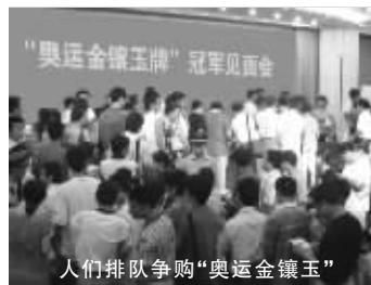
人们排队争购“奥运金镶玉”

地讲到:“俗话说‘金有价玉无价’,奖牌藏品‘奥运金镶玉’有金又有玉,还是‘和田玉’呢!我买六套,两套自己收藏,一套送儿子,一套送父亲,两套送客户,一举多得呢!”