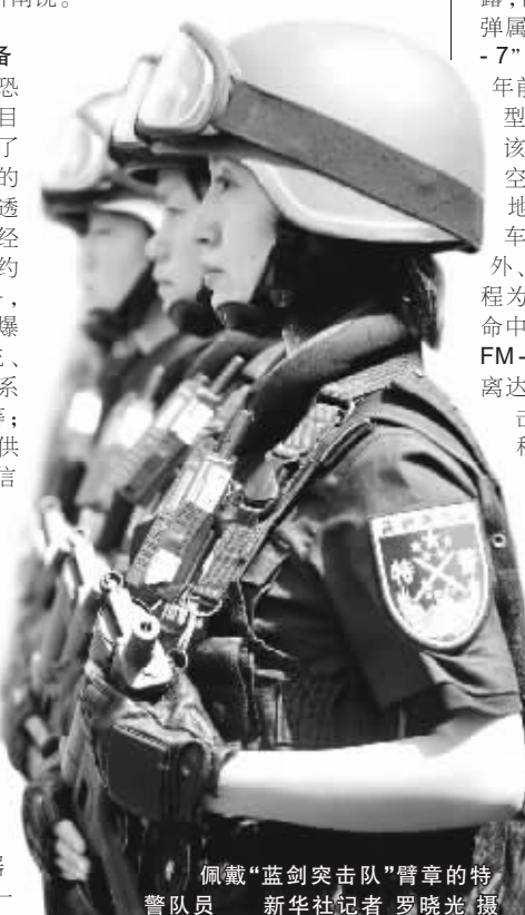
佩戴“蓝剑突击队”臂章的特警队员