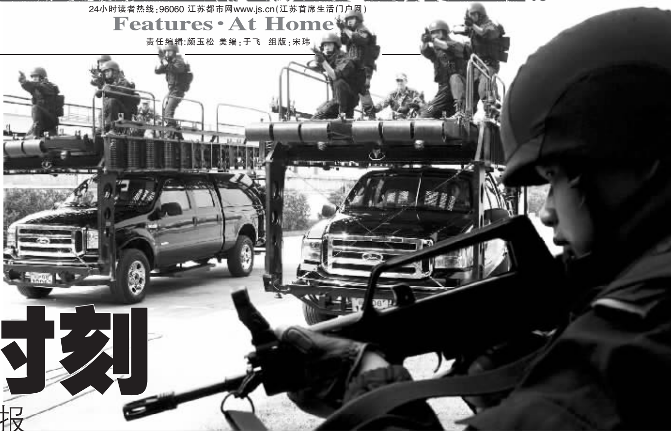
6月2日,武警反恐突击队员借助先进的越野攀登车迅速接近“可疑目标”

8月8日 尚未来临,反恐的大幕就已提前拉开。警犬开始在机场大厅四处巡逻,灯光闪烁的安检仪器出现在地铁门口,导弹防御装置将奥运场馆团团包围,各种反恐演习在各赛区依次展开……一场多国助力的奥运反恐攻坚战已经打响。