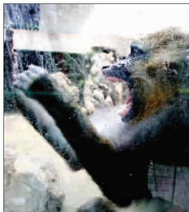
孤独的童年是这只小山魈患上自虐症的原因之一