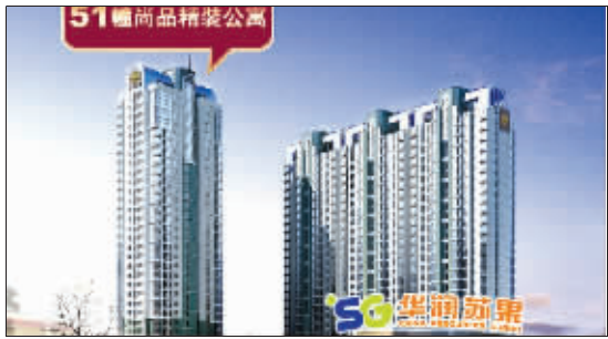
21世纪国际公寓效果图

21世纪地产在精装修产品的探索之路上起步较早,积累了丰富的操作经验。21世纪地产在海南、连云港曾连续塑造了多个精装修工程,打造的项目成为了当地楼盘开发的样板工程。作为21世纪地产南京精装修商品房市场的开山之作,公司特别拿出位置与景观视野最好的32层高的51幢做精装修,进行产品的提档升级。房源以中小户型为主,面积从41—97平方米不等,有简洁