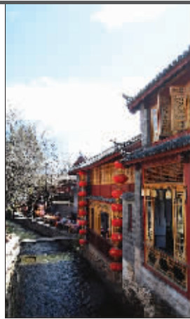
从南京起飞,一路脚踏彩云,3个小时10分钟后就可以到达丽江沐浴雪山美景、享受丽水清凉!

目前,这是南京至丽江的第一条直飞航线,是由海航集团金鹿航空公司与中青旅江苏国际旅行社有限公司合作,由中青旅江苏国际旅行社有限公司独家包租实施的。包机机型为客舱A319,较别的机型而言,起、坐更方便,乘坐更舒适,让游客的旅途更愉快。飞机每天10时30分从南京禄口国际机场起飞,于13时40分到达丽江机场;下午2时30分从丽江机场起飞,于下午5时40分到达南京。每天往返一班。南京直航丽江,游客上午