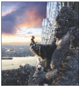
金刚登上了帝国大厦楼顶,与人类展开殊死搏斗

一提到美国,一系列的大片便会如电影片段般在我们的脑海中闪过。《金刚》《珍珠港》《侏罗纪公园》等,这些大片都和美国的景点紧密相连,让我们跟随大片,玩转美国吧!