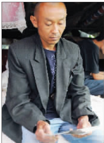
吴家方如今十分憔悴