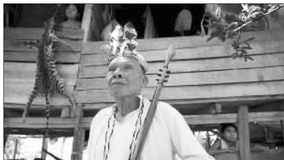
上图为流亡国王蒂托,下图为“篡位”的新国王瓦伦丁