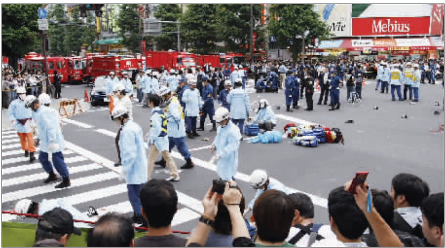
警察和医务人员在日本东京秋叶原车站附近检查

日本一名年轻男子8日中午时分在东京以动漫文化闻名的电器街秋叶原拔刀伤人,杀死至少7人,砍伤刺伤十余人。此人作案动机尚未查明,但媒体报道称嫌疑人的悲观厌世情绪可能是血案诱因。