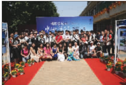
雅居乐摄影大赛开幕

在接下来的几天中,雅居乐花园现场将继续展示参赛者的作品,同时也会将现场创作的摄影作品展出,接受评审。