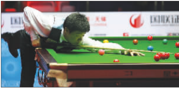
有丁俊晖,球市就有保证

丁俊晖赢了!昨天,2008年世界斯诺克江苏精英赛在奥体中心开战。在首日比赛中,丁俊晖以2:0和2:1的比分分别战胜世锦赛亚军卡特和队友李行。两连胜之后,丁俊晖小组出线形势一片大好。