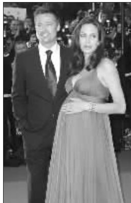
皮特和大肚子朱莉

32岁的朱莉与44岁的皮特已有4子,包括领养的3个孩子:6岁的马德克斯、4岁的派克斯和3岁的祖哈拉,以及两人的亲生子女、两岁的希洛。 万可