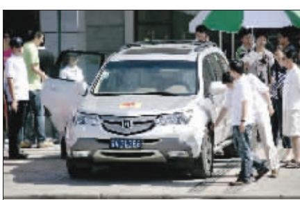
本版图\路军 常青 文\汪洪新