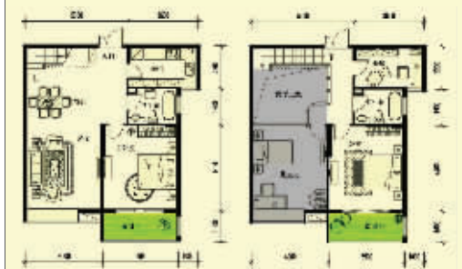
143平方米房源户型图

东方天郡团购活动首发的消息迅速传开。昨天,售楼处和编辑部的热线电话均被读者打爆。对楼盘久已心仪的消费者恰逢这一难得的团购机会,问题便特别的多。“团购怎么参加?”“是不是要提前看好房型?”“我周六加班,周日去还来得及吗?”为了方便大家看房、选房,他们将留出充裕的时间,购房者毋庸焦急,本周末双休日到场即可登记。