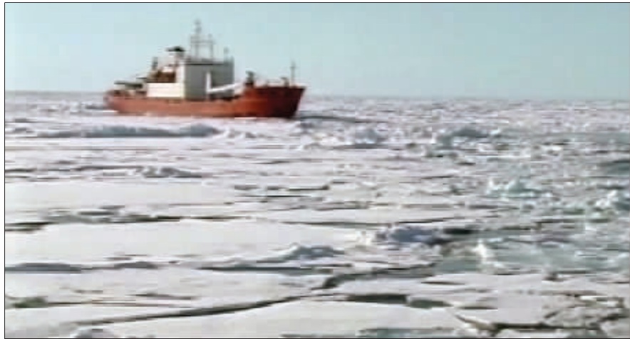
俄罗斯科考队的船只携带深海潜水器行驶在北冰洋海面

北极地区周边丹麦、俄罗斯、美国、加拿大和挪威五国高官27日在格陵兰岛举行会议,商讨如何解决北极领土归属争端。专家认为,随着北冰洋冰层消融,北极地区沉睡的丰富自然资源日渐“苏醒”,各方对北极领土的争夺可能将随之日益加剧。