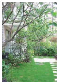
东方天郡绿色掩映

优惠幅度:此次快报读者团购,只要本周双休去该楼盘售楼处,不论市民所看中的户型销售价格是多少,一律享受团购折扣优惠,优惠幅度从1%-3%不等。按照100万元一套计算,本次团购的总价优惠最多能有3-4万元。