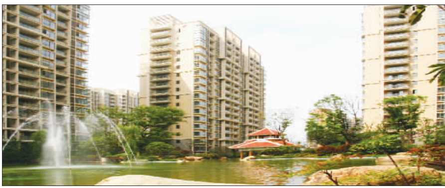
园林社区景观是东方天郡的一大特色

据销售部门介绍,东方天郡74平方米两房户型原本就是最受市场欢迎的产品之一。经过设计师的精心构思,去粗取精之后,不仅压缩了许多不必要的交通面积,大大提高了住房使用率,而且赋予产品施展空间变幻魔术的能力:74平方米的空间可分可合,既可以当作两房使用,也可以成为只