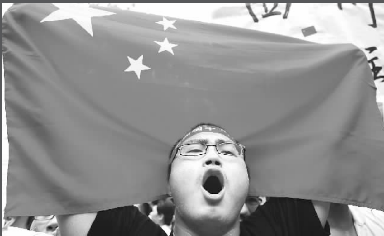
四川挺住,中国加油!

没有人带领,没有人问要走向哪里,也不问为什么,人群就这样浩浩荡荡从鼓楼广场沿着中山路一直往前走,个个喊得一脸一身的汗。一个大学生声音已经明显嘶哑,还在不停地带头喊“中国”、“四川”、“奥运”,而他的声音一出,马上有人跟着喊“加油”。人群中还有不少黑皮肤、高鼻子的“老外”。