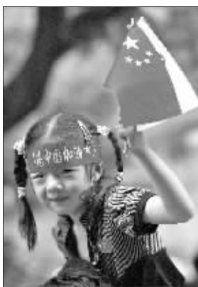
中国加油