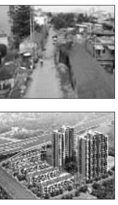
现状图(上)及规划鸟瞰图(下)对比