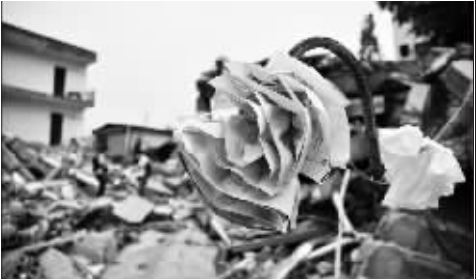
废墟上的“玫瑰花”带来重生的希望