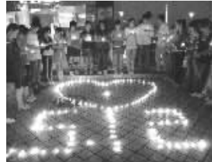
日前,江苏移动无锡分公司携手全市9所高校的1000余名动感学子,共同开展了“情系汶川 爱心祈愿”悼念地震遇难同胞的祈福活动。

在无锡移动有序组织下,无锡全市9所高校的1000余名动感地带用户同时点亮蜡烛并拼接成各种爱心图案,并齐唱《生死不离》,表达对地震死难者的哀悼和对灾区人民的美好祝愿。无锡移动还积极组织全市各高校的学生团体,向50余名家在地震灾区的动感学子发送了慰问彩信和短信,给予他们精神上的支持和鼓励。