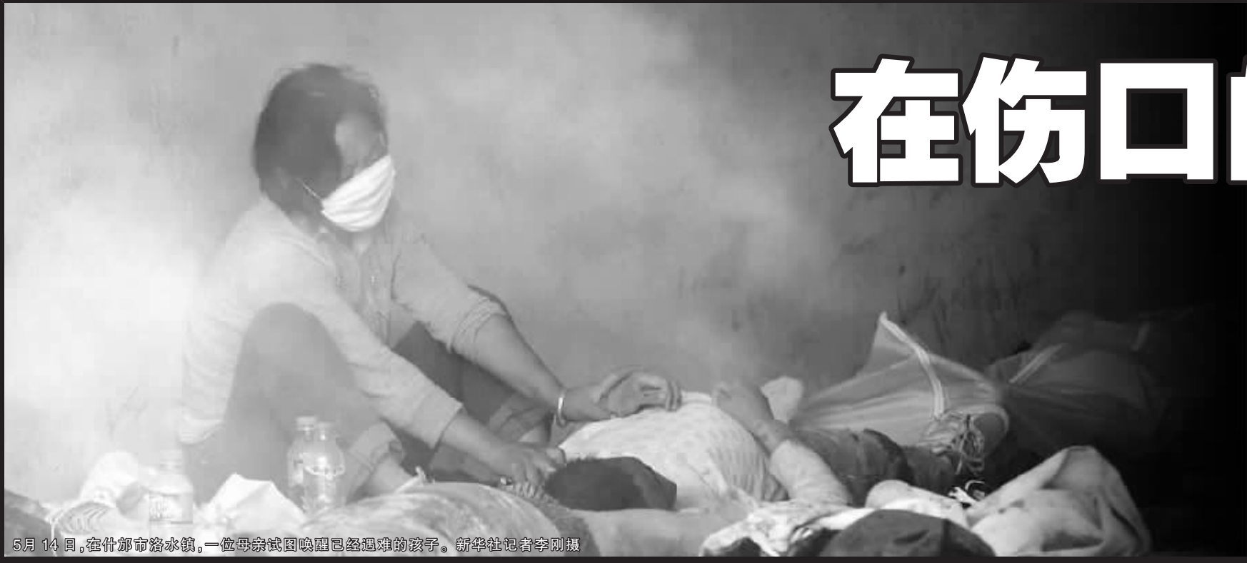
5月14日,在什邡市洛水镇,一位母亲试图唤醒已经遇难的儿子。