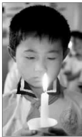
哀悼日,为遇难同胞祈祷