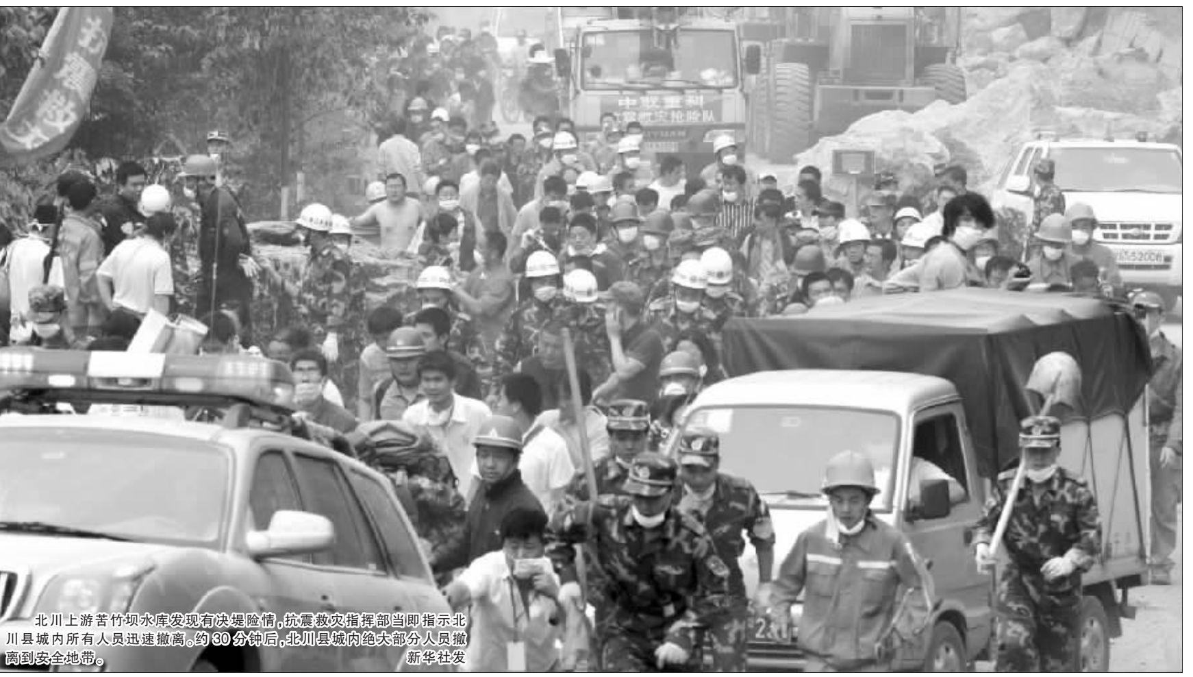
北川上游苦竹坝水库发现有决堤险情,抗震救灾指挥部当即指示北川县城内所有人员迅速撤离。约30分钟后,北川县城内绝大部分人员撤离到安全地带。

中共中央政治局常委、国务院总理、国务院抗震救灾总指挥部总指挥温家宝17日下午召开国务院抗震救灾总指挥部会议。温家宝称,国务院决定,在三个月内,向受灾地区困难群众每人每天发放一斤口粮和十元钱补助,对因灾死亡人员的家属每人发放5000元抚慰金。