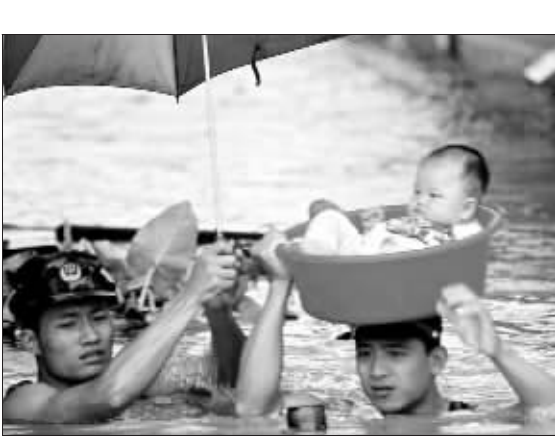
解放军官兵让一条幼小的生命获得了新生

历史记忆:1998年夏季,中国发生了百年不遇的特大洪水。特别是长江发生了自1954年以来的又一次全流域性特大洪水,东北嫩江、松花江也爆发了超历史纪录的特大洪水。据不完全统计,全国受灾面积3亿多亩,受灾人口2.2亿,直接经济损失2000亿元人民币。 国家及时作出了“严防死守,确保大堤安全,确保重要城市安全,确保人民生命安全”的指示,命令解放军全力支持抗洪抢险。近30万解放军和武警官兵火速赶往灾区,同沿江数百万干部群众一起日夜奋战,与洪水展开殊死搏斗。解放军官兵“人在堤在,誓与大