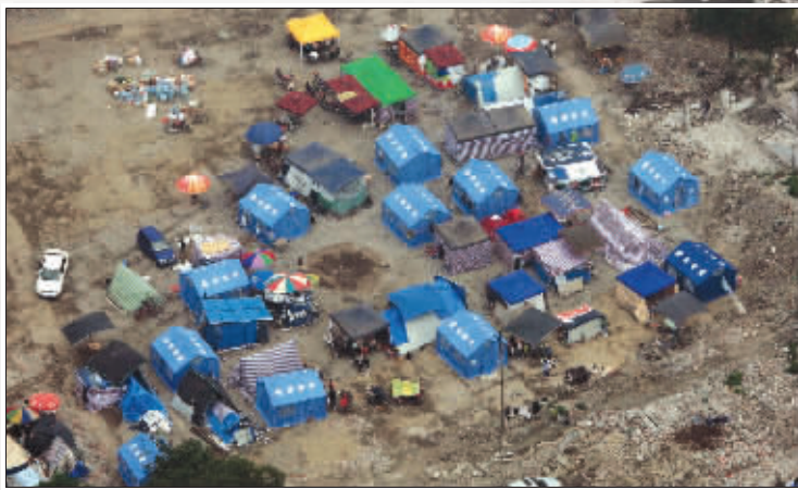
一顶顶蓝色的帐篷,是一个个临时的家。帐篷下,幸存的人们生活依然在继续