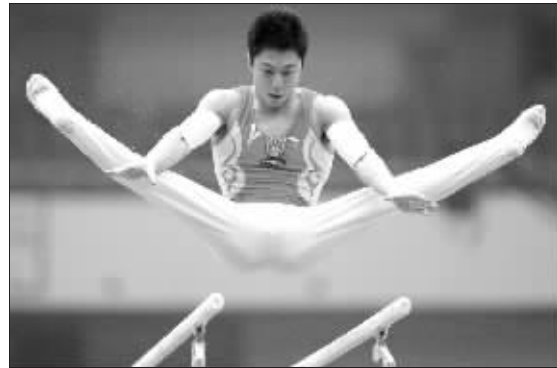
5月15日,中国队选手李小鹏在双杠决赛中夺得冠军。当日,国际体联2008年世界锦标赛中国天津站的单项决赛在天津体育馆举行。

相比于男队,中国女队的情况则是天壤之别,她们不仅因为和两个混合组同被抽到第一组而不得不上参加比赛,而且第一个项目就是失误可能性较大的平衡木。因此,女队主教练陆善真在抽签结束后只用“最差最差的签”这6个字评价了中国队的签位。