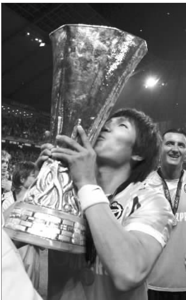
泽尼特球员亲吻奖杯