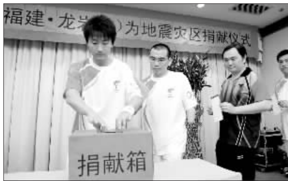
北京奥运会火炬传递福建龙岩站举行捐献仪式,为地震灾区献爱心。