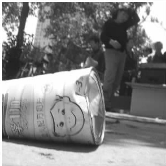
凹陷的奶粉罐

“高空抛物的危害你知道吗？据测试，一个鸡蛋从8楼抛下就可以让人头皮撕裂，一个铁钉从18楼坠下可插入人脑中，纵使一块西瓜皮，从25楼抛下也能致命。”北门桥3号是一座24层的居民楼，门口贴着杜绝高空抛物劝导告示。然而，这份“晓以利害”的告示并没有触动个别不自觉的人。昨天上午11点半左右，从楼上飞下的一只盛满水的奶粉罐将坐在楼下的一位女士砸得头破血流。