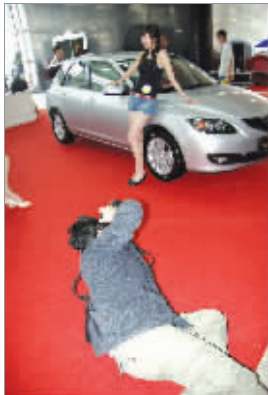
▲二等奖作品:《大师拍车展》