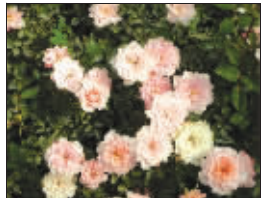
新培育出的微型月季“粉姬”