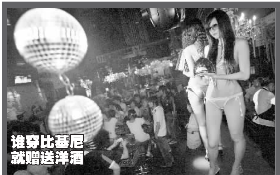
身着比基尼的美女们正在作秀。昨晚，一场比基尼派对在南京1912时尚街区酒吧内举行，酒吧打出了只要穿比基尼入场的女士便可获赠洋酒，这种在前几年让人觉得不可思议的促销方式如今产生了效果，不过吸引人的不是酒，而是美女们的火辣身材。

要不到钱，陈老太就把对方告上了法院，要求王琳赔偿余下的钱。法院审理后认为，王琳没有证据证明自己的说法，所以不予采信。最终，江宁区法院判决陈老太受伤的医疗费、护理费等费用共计近5000元，由王琳家赔偿。（文中人物系化名）