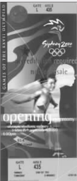
2000年奥运会开幕式门票