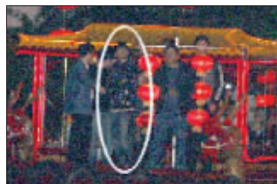
站在船上欣赏秦淮美景