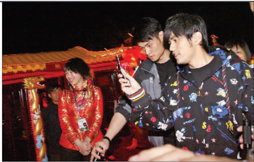
还没上船,周董就拍了起来