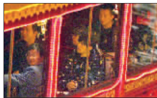
周董悠闲地坐船游秦淮