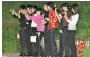
歌迷兴奋地拍偶像