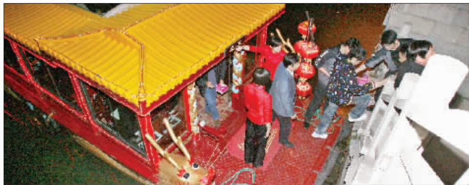
随行人员小心翼翼地扶周董上码头