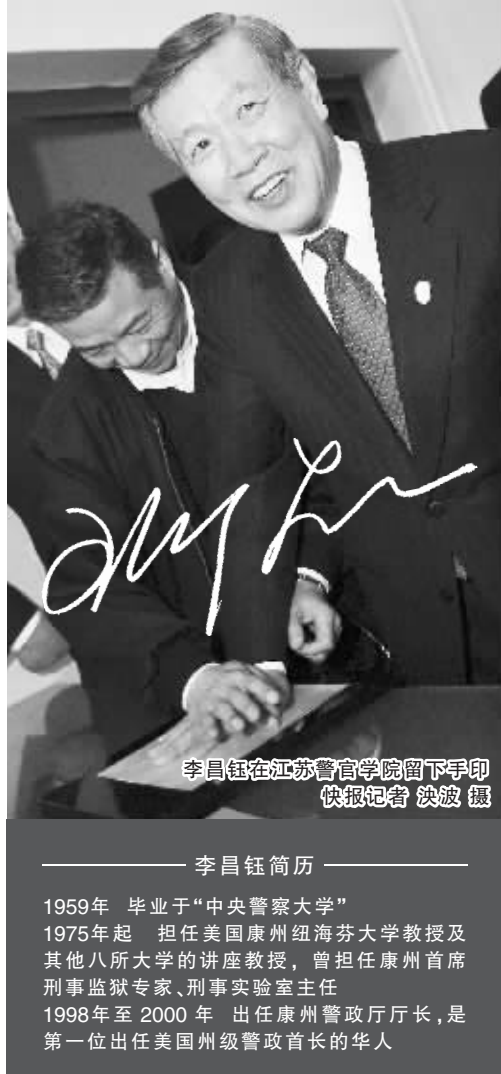
李昌钰在江苏警官学院留下手印