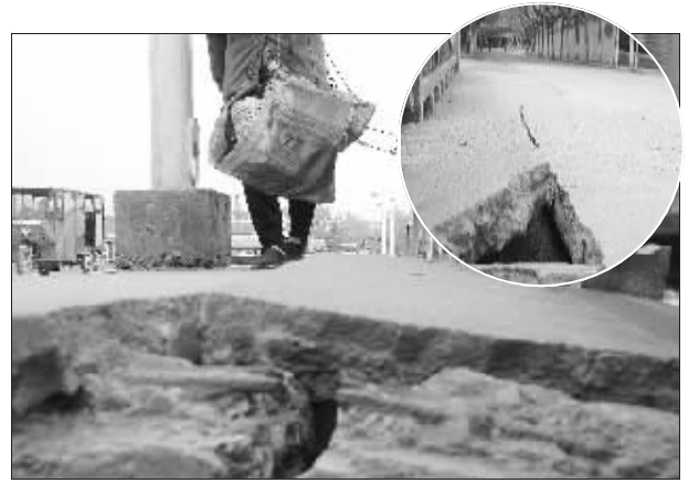
桥面断裂严重

快报讯(记者 薛林)桥上人行道，赫然有一处直径约40厘米大洞，旁边是一条长约2米的裂缝。这是记者昨天在雨花台区西善桥一座横跨外秦淮河钢筋混凝土大桥上看到的情景，当地居民希望有关部门尽快维修，消除隐患。