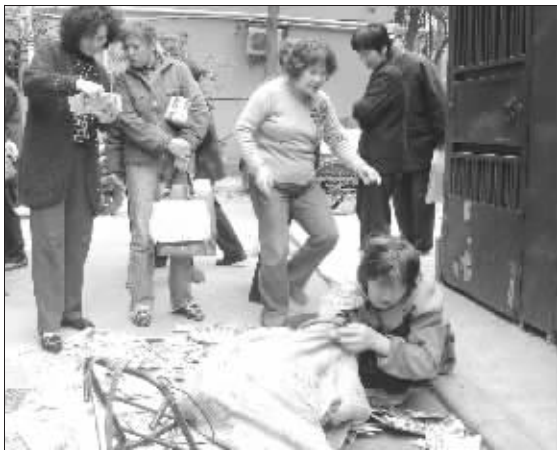
偷来的信件装满一蛇皮袋

快报讯(记者 马晶晶)这个小偷真奇怪，专门撬小区楼下的邮箱，偷取信件，而更让人惊讶的是，小偷竟然将偷来的信件当废品卖。