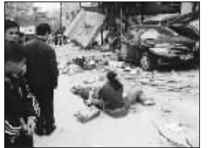
南阳独山景区车祸现场伤亡惨重,惨不忍睹