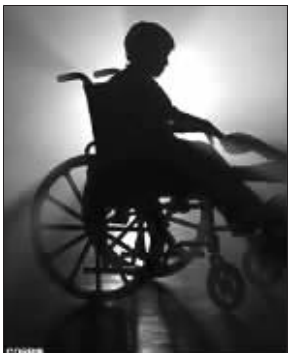
健康儿子坐了5年轮椅

5年时间里,这名母亲总是用轮椅推着儿子外出。日前,这名荒唐的母亲被英国法庭判处了4年监禁。