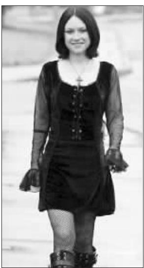
终于成为健康女孩

室中不停地走来走去。当她停下脚步时,她也会在家中的淡衣板上写一些谜题,让自己继续站着解谜。