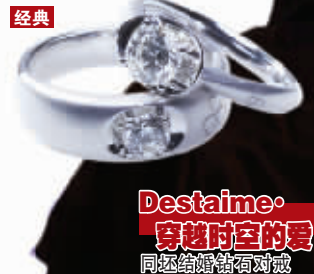
Destaime·穿越时空的爱 同坯结婚钻石对戒