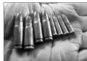
捡到的子弹

快报讯(记者 陈泓江)在街头一垃圾箱里,拾荒为生的胡女士发现一包“宝贝”。不过,“宝贝”没给她带来惊喜,反把她吓得一夜没睡着。昨天上午,她带着“宝贝”走进了派出所,民警也吓得不轻:“你哪来这么多子弹?”