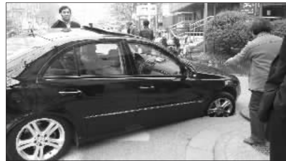
奔驰车前轮陷进无盖窨井