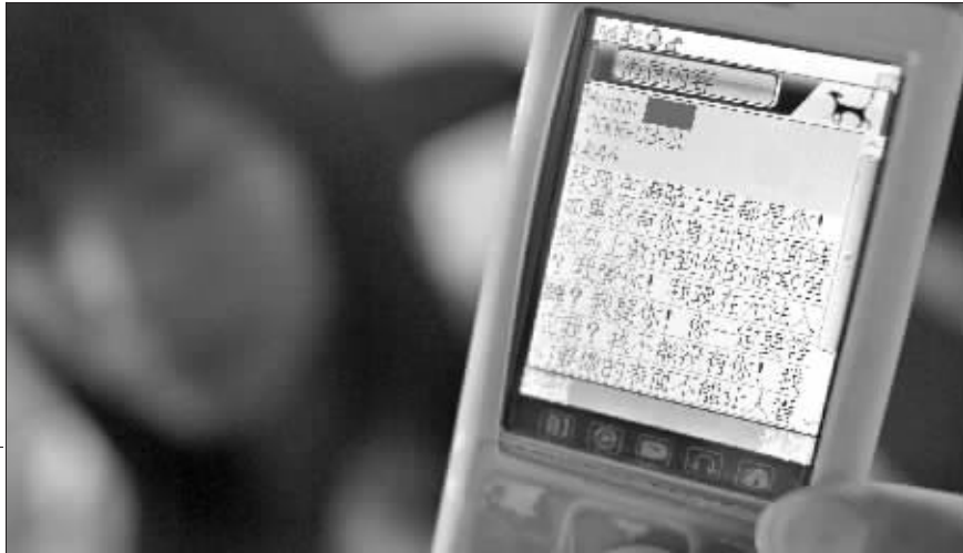
打工妹将老板的暧昧短信保存下来

一个刚上班的打工妹,两个多小时内收到老板16条暧昧短信的“密集轰炸”,且一条比一条肉麻露骨。惊吓之余,女孩将短信全部复制保存。而面对证据,老板连称自己昏了头。