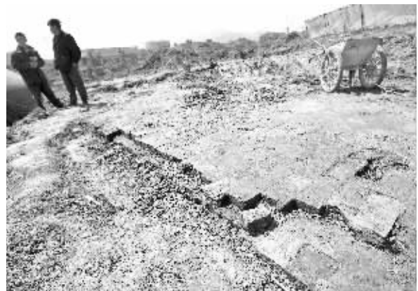
古墓的墓顶已经露了出来