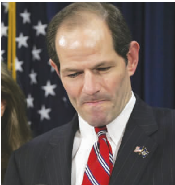
“9号客户”斯皮策因召妓黯然下台

美国纽约州前州长斯皮策因召妓丑闻身败名裂,而“炮制”这一爆炸性事件的人却是斯皮策的政敌——共和党的顾问罗杰·斯通。斯通承认于去年11月19日通过律师向联邦调查局(FBI)发出告密信,指称斯皮策在佛罗里达州与高级妓女鬼混,成功令斯皮策陷入万劫不复的境地。