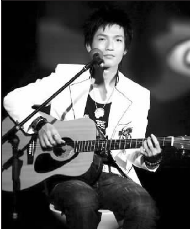
中国网络媒体首届“感动中国人物”陈楚生入选理由

陈楚生作为唯一入选的音乐人,能否当选“感动中国人物”?此事在网上引发了激烈争议。反对者措辞激烈地表示,“他算哪门子大人物?而支持者认为,陈楚生也是平民出身,他执著于梦想,感动了平凡大众!