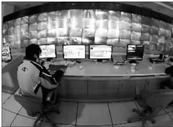
南京城建隧桥公司的隧道监控中心

江苏省农林厅一位相关人士昨天对记者说,影响生猪价格的主要是饲料。据介绍,含量达到43%的豆粕价格已经涨到3800~3900元/吨,而根据他们调查,豆粕降价的可能性非常小,因为目前豆粕40%~60%依赖进口。另外玉米的价格虽较节前有所回落,但是预计五月份可能还会涨,所以今后几个月猪饲料以及生猪价格仍将在高位徘徊。这位人士认为,跌是不可能的,大涨也是不可能的。