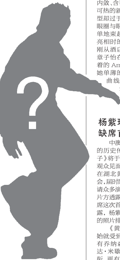
著名男艺人卷入“艳照门”