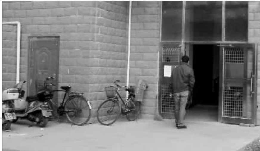
保洁员就是从这栋楼内的垃圾中发现巨款的

小区保洁员在垃圾堆中发现十多万元现金后,主动上交给物业公司领导。几分钟后,一自称是“失主”的女士领走了这笔巨款,并承诺当晚酬谢保洁员 2000 元,可如今事情已过去十天了,“失主”一直未现身兑现承诺。