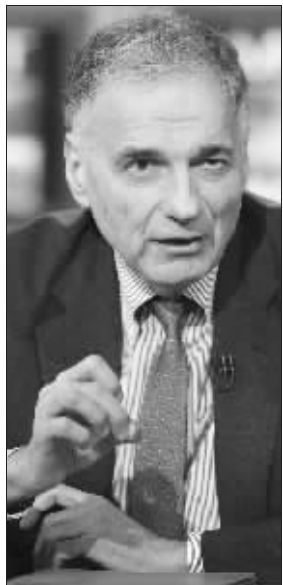
纳德 24 日宣布以独立候选人身份再次参选