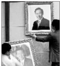
撤下卢武铉肖像,换上了李明博的肖像