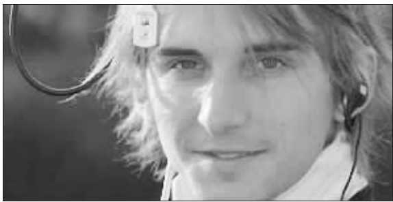
色盲画家尼尔·哈比森