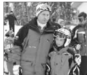
滑雪时与一个小女孩合影